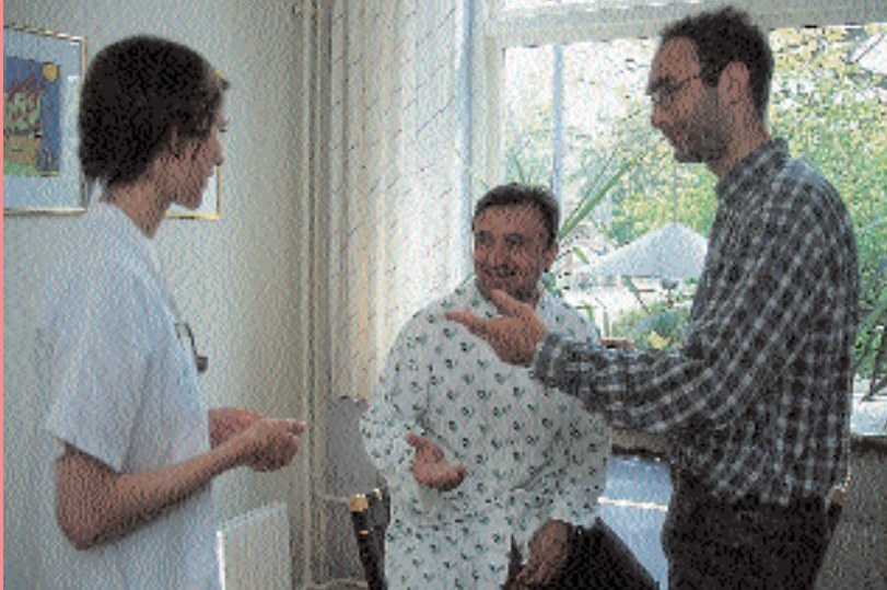
Dil sorunları olacak olursa hastahane tercümana ihtiyacınız olup olmadığına karar verecektir.

Dil sorunları olacak olursa hastahane tercümana ihtiyacınız olup olmadığına karar verecektir. Tercümanlar hastalarla ilgili ayrıntıların gizli tutulmasına ilişkin mevzuata tabidirler. Kendi tercümanınızı getirmenize izin verilmez.