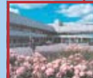
Helsingør Sygehus Esrumvej 145 3000 Helsingør Tlf. 48 29 49 49