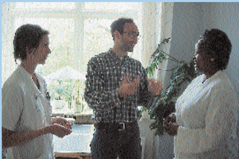
Shaqaalaha isbitaalka ayaa qaymeynaya in loo baahan yahay qof turjuma iyo in kale.

Haddii ay timaado dhibaato la xariirta xagga afka, isbitaalka ayaa qaymaynaya in loo baahan yahay mutarjum iyo in kale. Qofka mutarjumka ahi waa ruux sir lagu aammini karo. Waxaa la idinka codsanayaa in iinaan idinku soo wadan mutarjum.