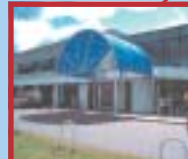
Hørsholm Sygehus Usserød Kongevej 102 2970 Hørsholm Tlf. 48 29 29 29