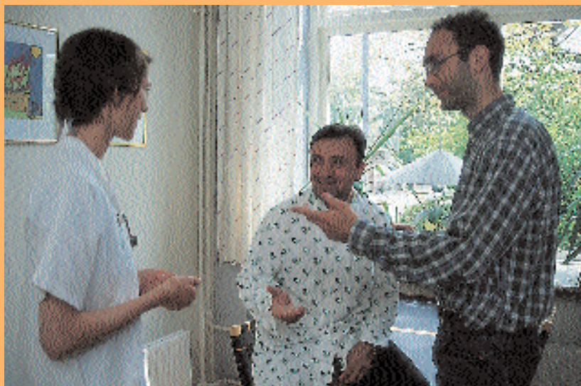
Sygehuset vurderer, om der er brug for en tolk, når der opstår problemer med sproget.

Når der opstår problemer med sproget, bestiller personalet på sygehuset en tolk. Tolken har tavshedspligt. Du skal ikke selv medbringe en tolk.